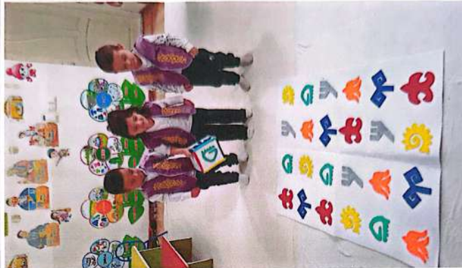
Физминутка (Игра-разминка «Хорошо») (Дети встают в круг)

У каждой страны есть свой флаг и герб, национальные игры, национальные орнаменты я предлагаю вам поиграть в игру «Найди совпадающие орнаменты» (дети по очереди бросают кубики с национальными орнаментами).